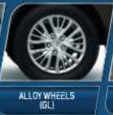
ALLOY WHEELS (GL)