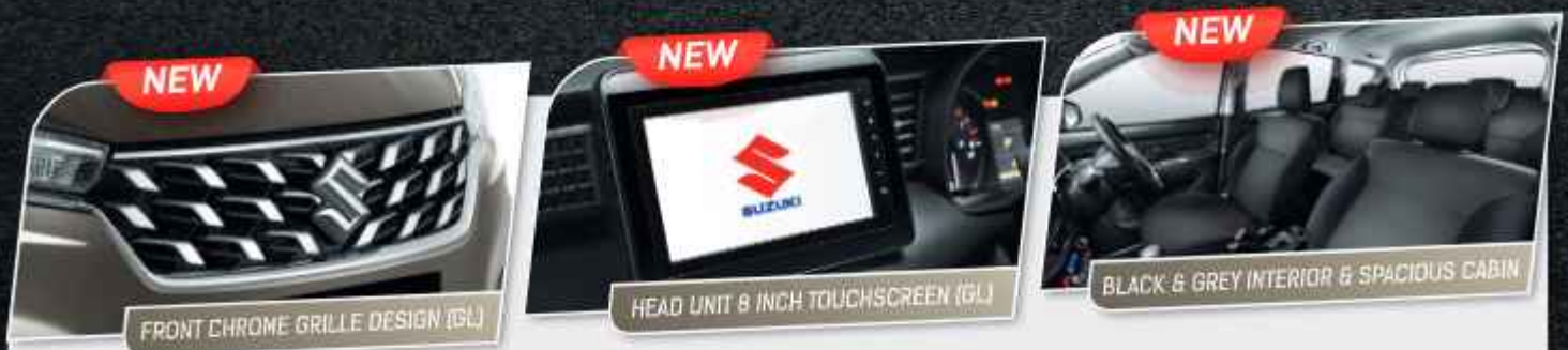
FRONT CHROME GRILLE DESIGN (GLI)