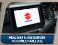
HEAD UNIT & NEW GARNISH INSTRUMENT PANEL (GL)