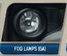
FOG LAMPS (GA)