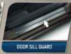
DOOR SILL GUARD