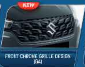
FRONT CHROME GRILLE DESIGN (GA)