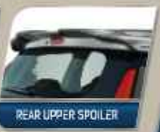
REAR UPPER SPOILER