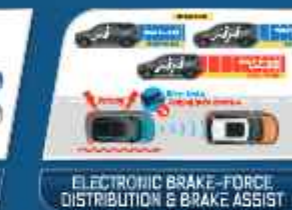
ELECTRONIC BRAKE-FORCE DISTRIBUTION & BRAKE ASSIST