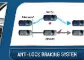
ANTI-LOCK BRAKING SYSTEM