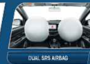
DUAL SRS AIRBAG