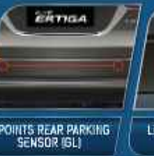
2 POINTS REAR PARKING SENSOR (GL)