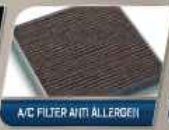
A/C FILTER ANTI-ALLERGEN