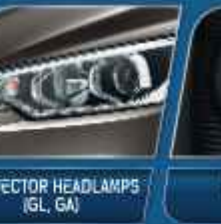
PROJECTOR HEADLAMPS (GL, GA)