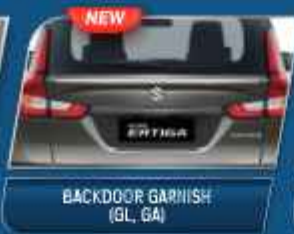
BACKDOOR GARNISH (GL, GA)