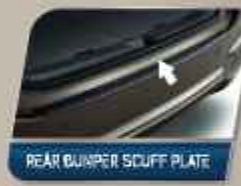
REAR BUMPER SCUFF PLATE