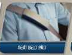
SEAT BELT PAD