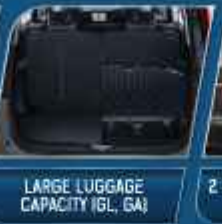
LARGE LUGGAGE CAPACITY (GL, GA)