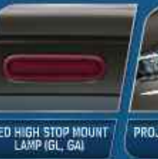
LED HIGH STOP MOUNT LAMP (GL, GA)