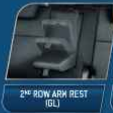
2 ND ROW ARM REST (GL)