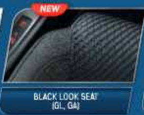
BLACK LOOK SEAT (GL, GA)