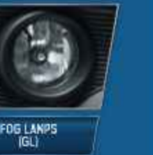
FOG LAMPS (GL)