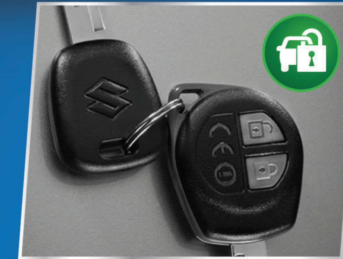
IMMOBILIZER & KEYLESS ENTRY

Bentuk sporty dengan lingkaran lebih besar untuk stabilitas yang lebih baik.