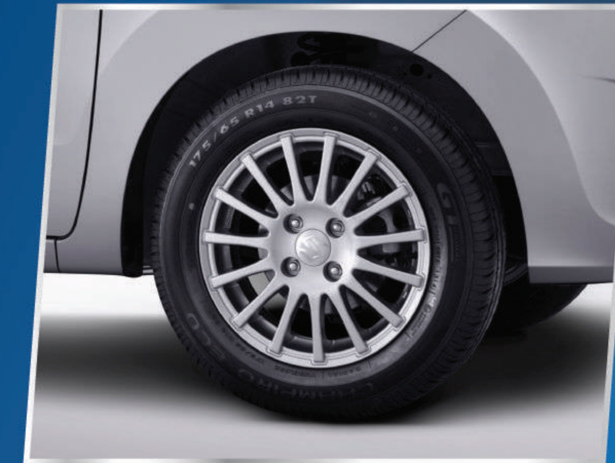
14" ALLOY WHEEL

Tampilan eksterior baru yang semakin meningkatkan tampilan dari Karimun Wagon R GS.