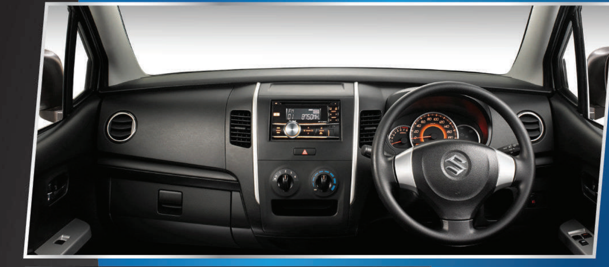
SPACIOUS CABIN WITH MODERN DASHBOARD

Power outlet serbaguna yang mudah dijangkau.