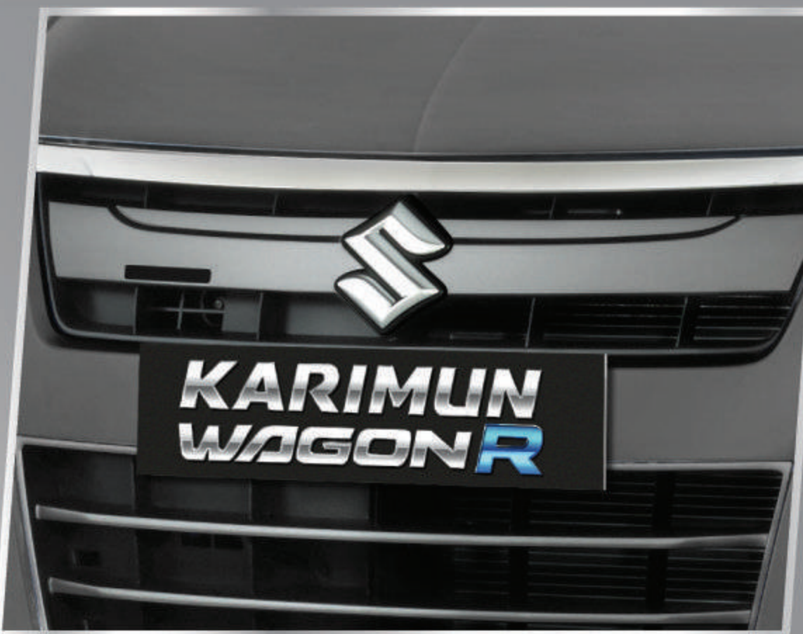
S LOGO ON THE GRILLE

Terlihat semakin elegan dengan logo S chrome.