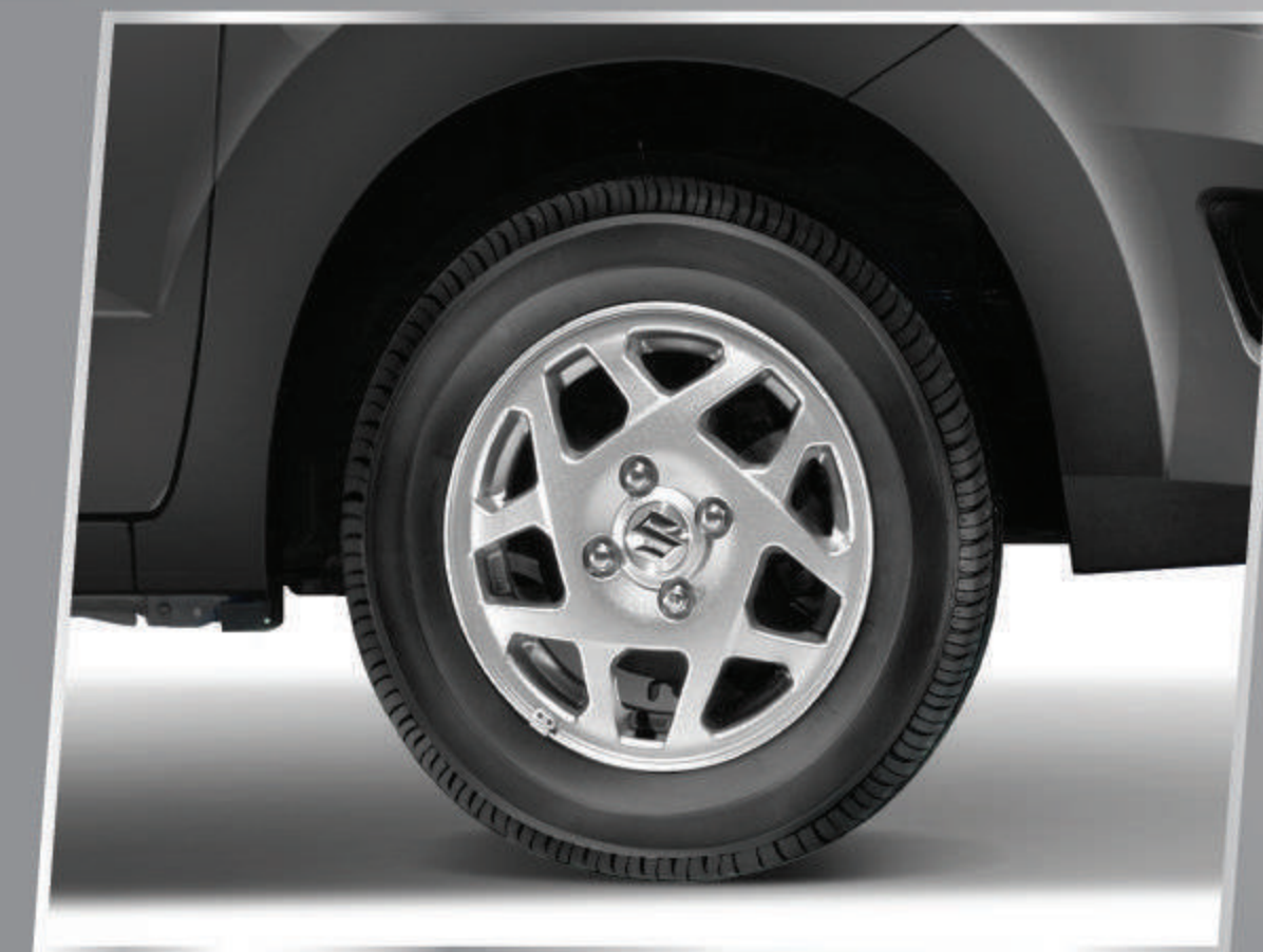
13" STAR SHAPE ALLOY WHEEL

Terlihat semakin elegan dengan logo S chrome.