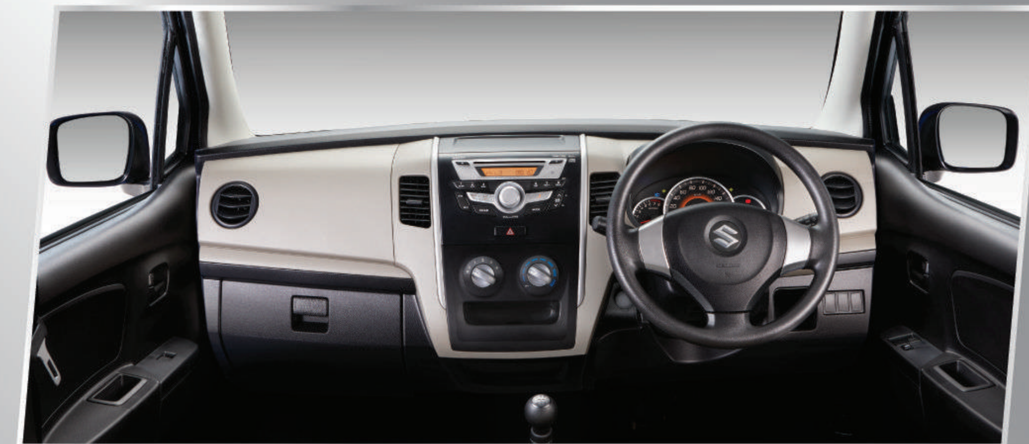
NEW COLOR GARNISH DASHBOARD

Dashboard dengan warna baru yang membuat kabin semakin nyaman dan elegan.