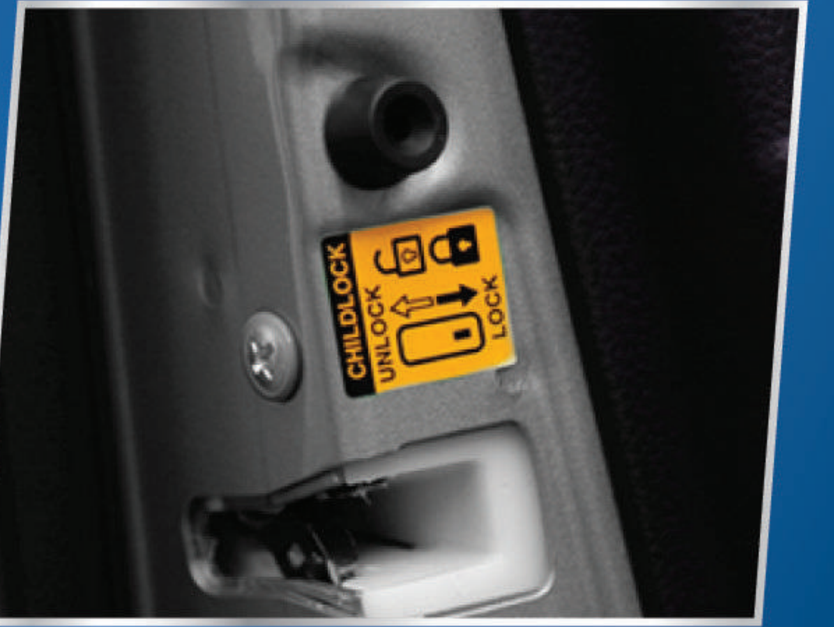
CHILD PROOF DOOR LOCK

Memberikan kemudahan untuk membuka jendela depan.