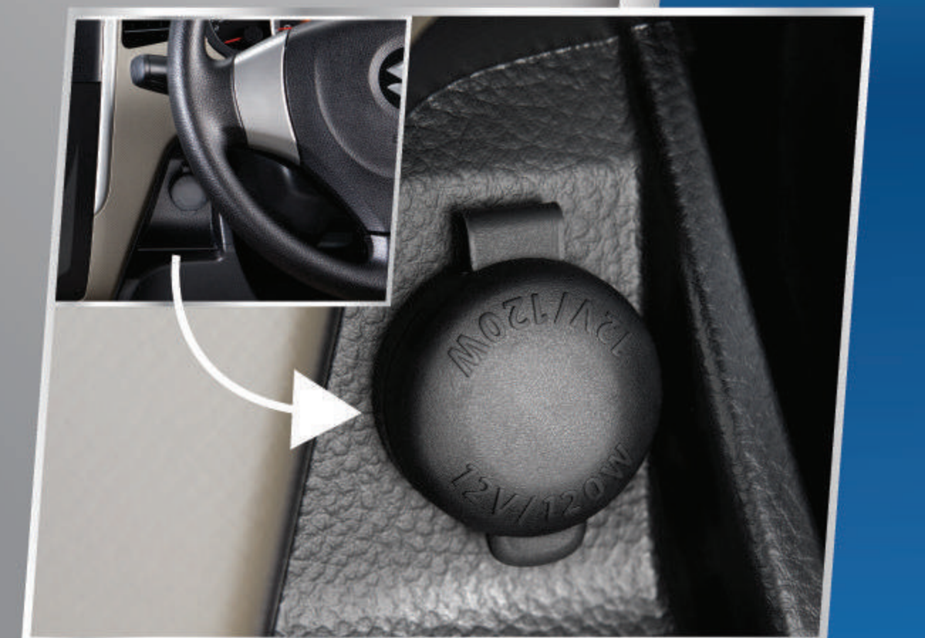
POWER OUTLET 12 V

Audio system baru yang menyatu dengan dashboard.