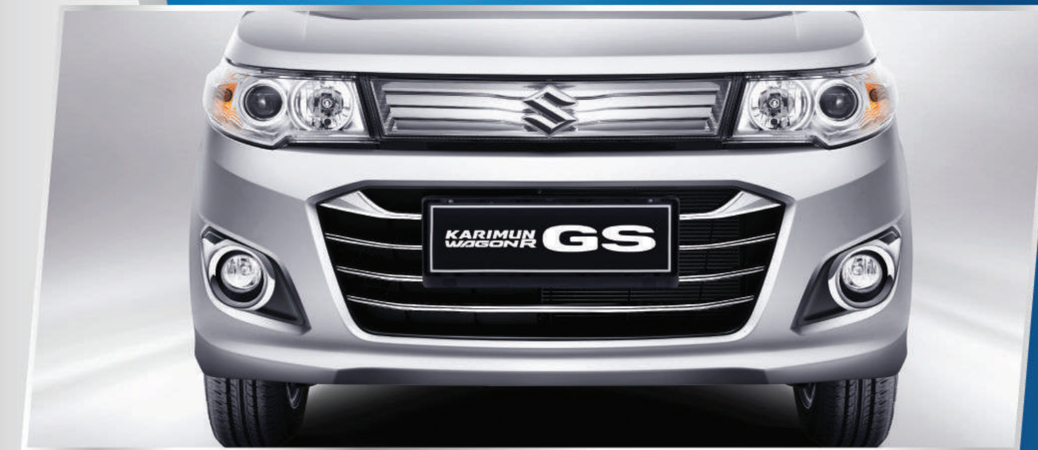
NEW FRONT GRILLE, HEADLAMPS, FOG LAMPS

Tampilan eksterior baru yang semakin meningkatkan tampilan dari Karimun Wagon R GS.