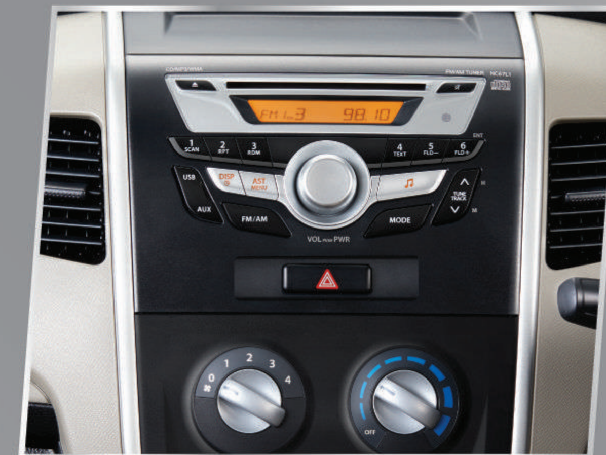
INTEGRATED AUDIO PANEL

Dashboard dengan warna baru yang membuat kabin semakin nyaman dan elegan.