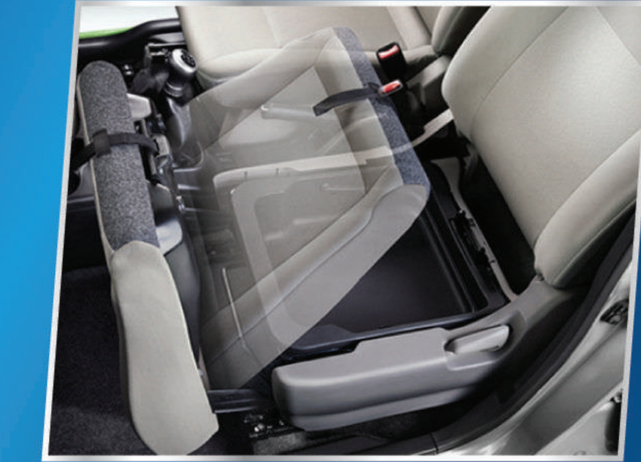
UNDER SEAT TRAY

Aliran udara dingin yang beriklan nyaman ke seluruh kabin.