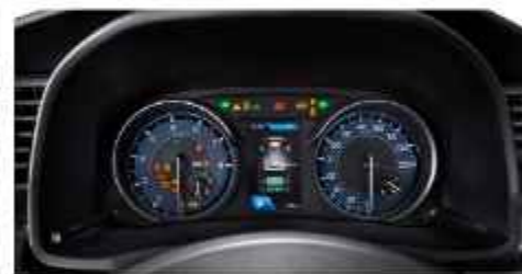
METER CLUSTER WITH MID (Cruise & GX)