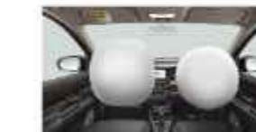
DUAL SRS AIRBAGS