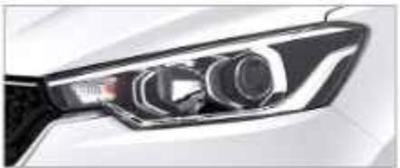
PROJECTOR HEADLAMPS WITH AUTO HEADLIGHT & GUIDE ME LIGHT (Cruise, GX)