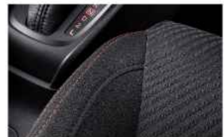
RED STITCH SEAT COVER