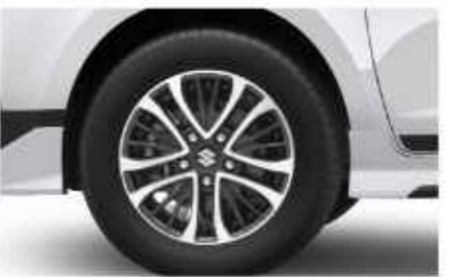
DUAL TONE ALLOY WHEEL

GEAR TO EXHILARATE CRUISE TO ENERGIZE YOUR LIFE