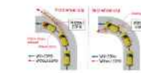
ESP**[ELECTRONIC STABILITY PROGRAMME] (Cruise & GX)

Keamanan merupakan faktor penting dalam mobil keluarga. Suzuki All New Ertiga Hybrid dilengkapi dengan fitur-fitur keamanan dan keselamatan berstandar internasional.