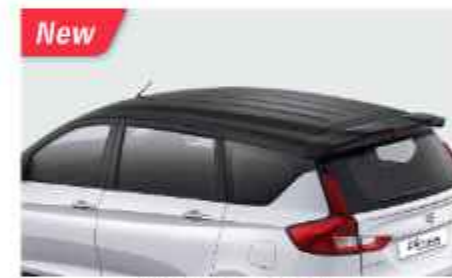
TWO TONE COLOR (PEARL SNOW WHITE BODY COLOR + COOL BLACK ROOF)