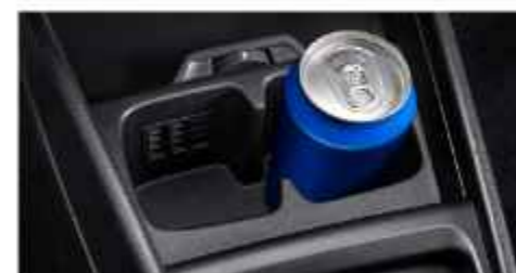
VENTILATED CUP HOLDER (Cruise & GX)