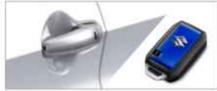
SMART ENTRY & SMART KEY (Cruise, GX)