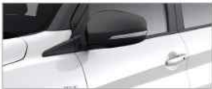
ELECTRIC AND AUTO FOLDABLE MIRROR WITH TURN SIGNAL LAMP (Cruise, GX)