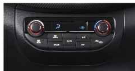
AC DIGITAL AUTO CLIMATE WITH HEATER (Cruise & GX)