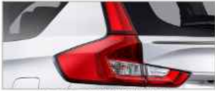
LED REAR COMBINATION LAMP WITH LIGHT GUIDE (Cruise & GX)