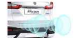
PARKING SENSORS (Cruise, GX & GL)