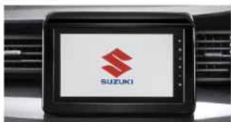
HEAD UNIT & 8 INCH TOUCHSCREEN WITH MIRRORING (Cruise, GX & GL)