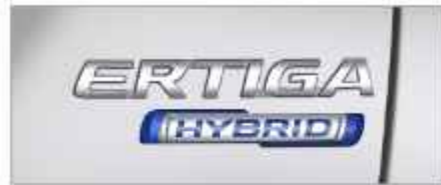
HYBRID EMBLEM (Cruise, GX)

Nikmati hari yang lebih baik dan perjalanan yang lebih seru bersama All New Ertiga Hybrid yang dilengkapi fitur-fitur terkini untuk seluruh keluarga.