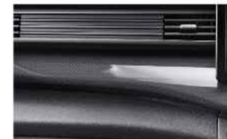
CARBON FIBER INTERIOR ORNAMENT