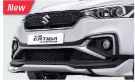
FRONT GARNISH BUMPER