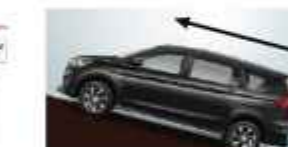
HILL HOLD CONTROL (AT: Cruise & GX)