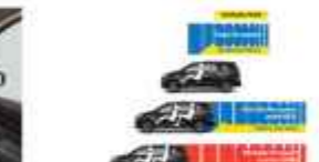
ABS, EBD, BA