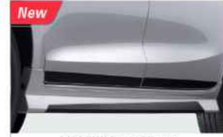
SIDE UNDER SPOILER & SIDE BODY DECAL