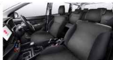
BLACK & GREY INTERIOR AMBIENCE Lebih Nyaman dan Berkelas.