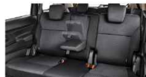
2 ND ROW ARMREST (Cruise, GX & GL)