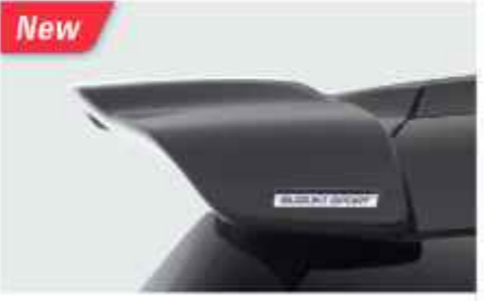
REAR UPPER SPOILER