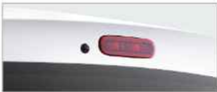
LED HIGH MOUNT STOP LAMP (Cruise, GX & GL)