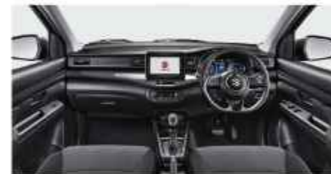
INTERIOR ORNAMENT Material Baru dengan Alisen Carbon Fiber (Cruise) dan Charcoal (GX)

Perjalanan bersama keluarga terasa lebih menyenangkan, dengan kabin lega, jok yang lebih nyaman, serta berbagai fitur yang memberikan kenyamanan untuk semua.