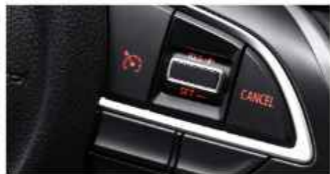
CRUISE CONTROL (Cruise & GX)