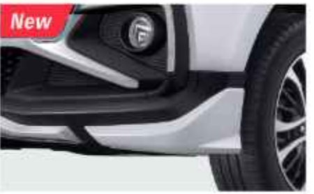
FRONT UNDER SPOILER