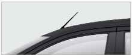
SHORT POLE ANTENNA (Cruise, GX & GL)