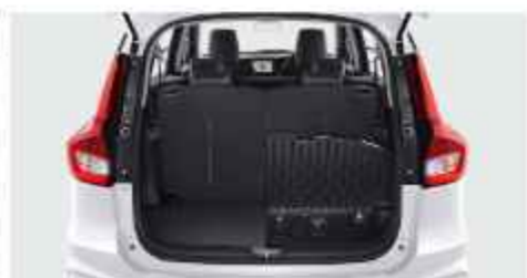
LARGE LUGGAGE CAPACITY