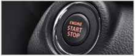
PUSH START/STOP BUTTON (Cruise, GX)