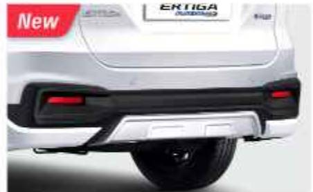
REAR UNDER SPOILER