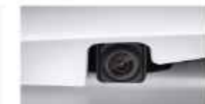
REAR CAMERA (Cruise)