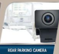
REAR PARKING CAMERA