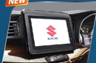
HEAD UNIT TOUCHSCREEN 8 INCH + REMOTE (SUZUKI SPORT & GX)