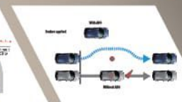
ANTI-LOCK BRAKING SYSTEM