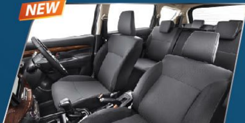
BLACK INTERIOR & SPACIOUS CABIN (SUZUKI SPORT & GX)