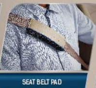
SEAT BELT PAD