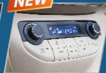
A/C DIGITAL (GL)