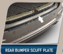
REAR BUMPER SCUFF PLATE