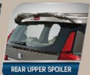
REAR UPPER SPOILER