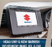
HEAD UNIT & NEW GARNISH INSTRUMENT PANEL (GL & GA)