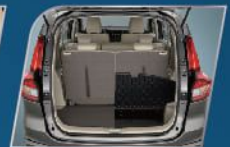
LARGE LUGGAGE CAPACITY