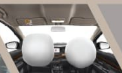
DUAL SRS AIRBAGS