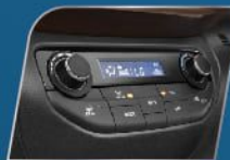
A/C AUTO CLIMATE WITH HEATER (SUZUKI SPORT & GX)