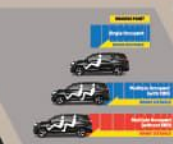
ELECTRONIC BRAKE - FORCE DISTRIBUTION