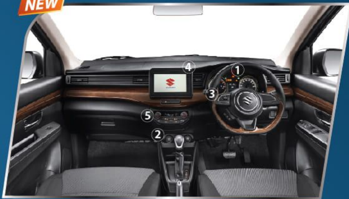
LUXURIOUS INSTRUMENT PANEL + DASHBOARD WITH WOODEN PATTERN & BLACK INTERIOR COLOR (SUZUKI SPORT & GX)