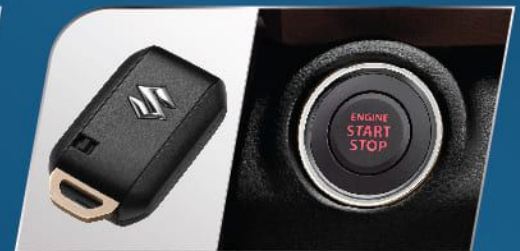
PUSH START/STOP BUTTON & REMOTE (SUZUKI SPORT & GX)