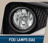
FOG LAMPS (GA)