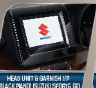
HEAD UNIT & GARNISH I/P (BLACK PIANO) (SUZUKI SPORT & GX)