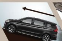
HILL HOLD CONTROL*