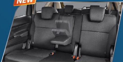
2 nd ROW ARMREST (SUZUKI SPORT, GX & GL)