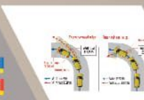
ELECTRONIC STABILITY PROGRAMME