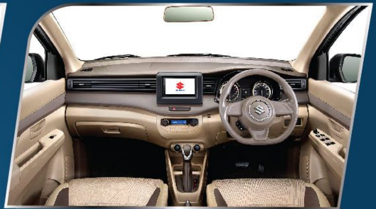
ELEGANT DASHBOARD + INSTRUMENT PANEL WITH BEIGE INTERIOR COLOR (GL & GA)