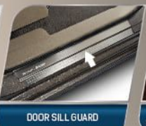
DOOR SILL GUARD