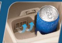
VENTILATED CUP HOLDER